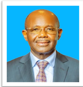
Mhe. Prof. Makame M. Mbarawa (Mb.) Waziri wa Uchukuzi