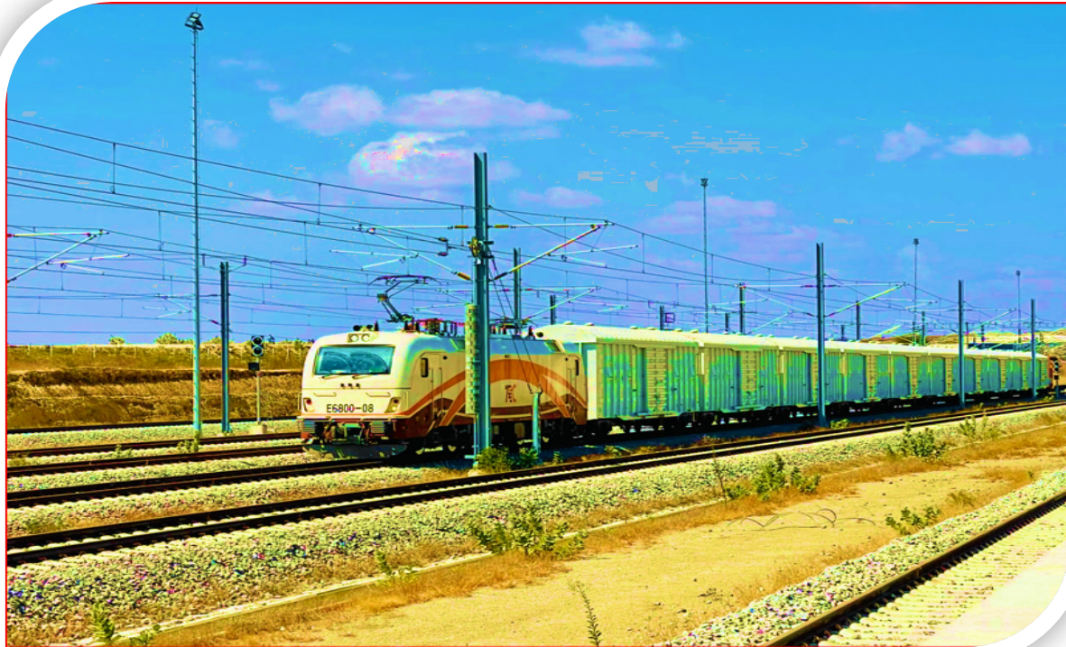
Treni ya SGR ya Mizigo inayofanya safari zake kutoka Dar es Salaam kuelekea Dodoma.