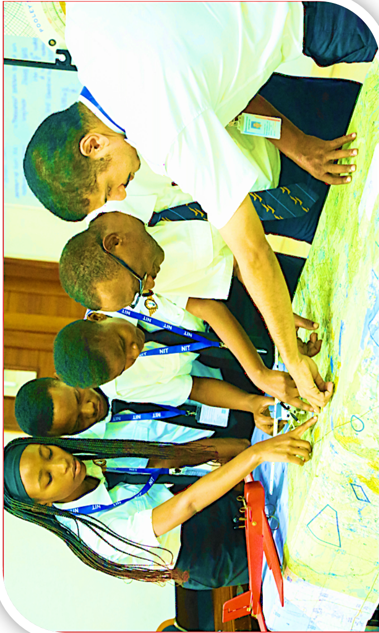
Wanafunzi wa Kozi ya kwanza ya Urubani wakiendelea na mafunzo katika Chuo cha Taiifa cha Usafirishaji (NIT), mafunzo hayo yalianza kutolewa rasmi tarehe 8 Julai, 2025.