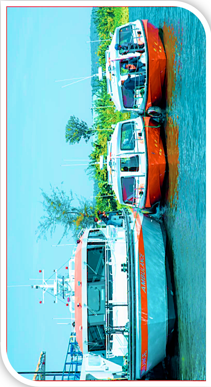
Boti ya Kubebea Wagonjwa (Ambulance Boat) na Boti mbili (2) za Utafutaji na Uokoaji Majini ambazo zimenunuliwa na Serikali ambazo zimeanza kutoa huduma katika Ziwa Victoria.