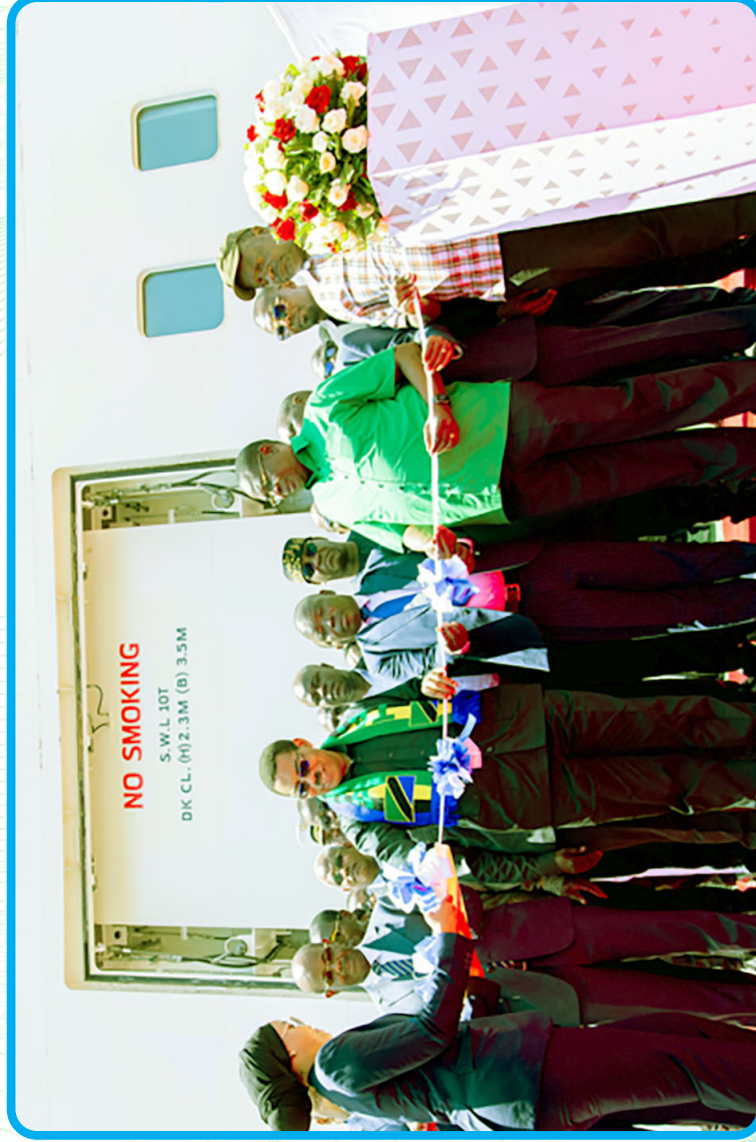
Mhe. Dkt. Muigwili Lameck Nchemba, Waziri Mkuu wa Jamhuri ya Muungano wa Tanzania pamoja na Viongozi wa Serikali akikata utepe kuashiria uzinduzi rasmi wa meli ya Mu. Neu Mwanza tarehe 23 Januari, 2026.