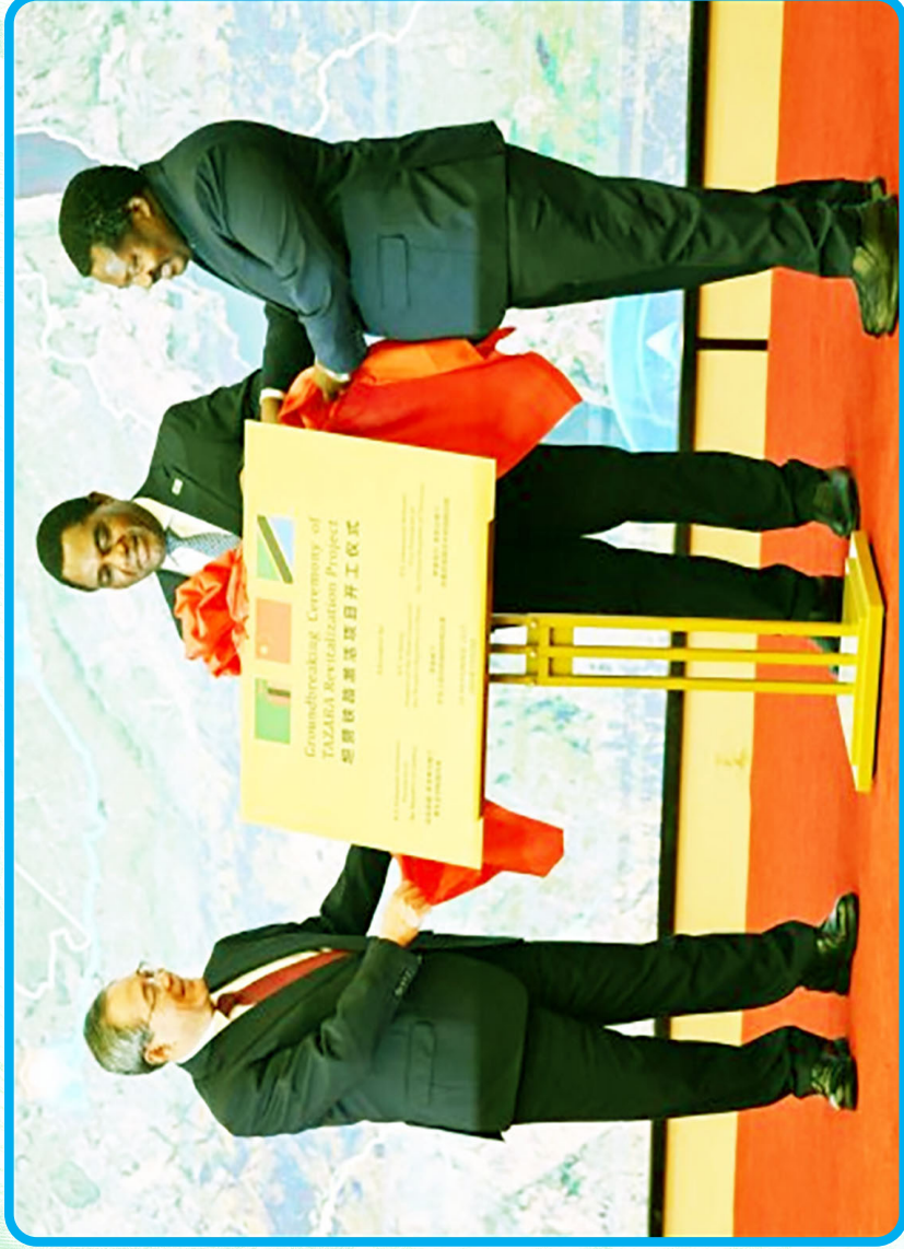
Mhe. Balozi Dkt. Emmanuel John Nchimbi, Makamu wa Rais wa Jamhuri ya Muungano wa Tanzania (kulia), Mhe. Hakainde Hichilema, Rais wa Zambia na Mhe. Li Qiang, Waziri Mkuu wa Jamhuri ya Watu wa China wakiweka jiwe la msingi la uboreshaji wa Reli ya TAZARA Jijini Lusaka, Zambia tarehe 20 Novemba, 2025.