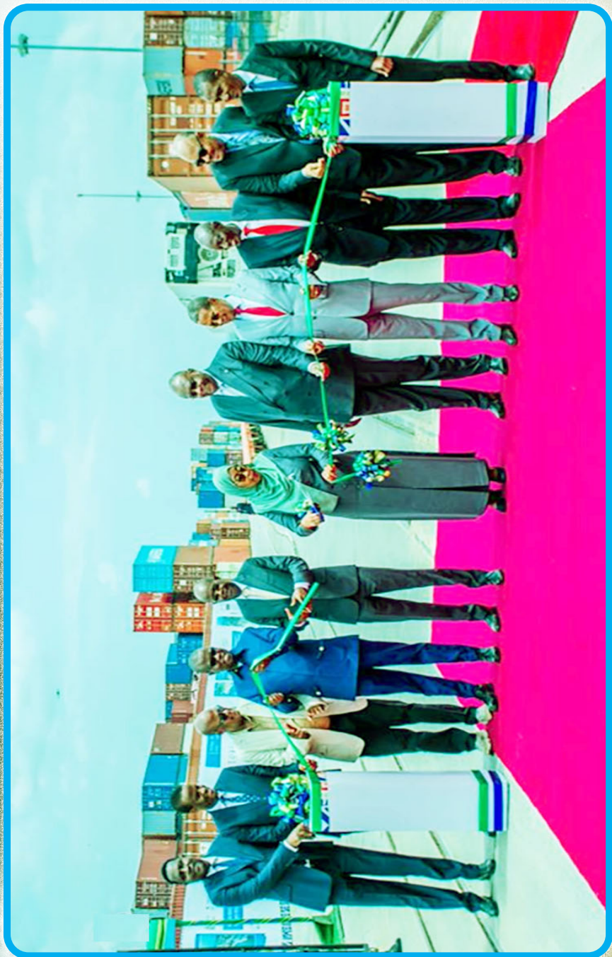
Mhe. Dkt. Samia Suluhu Hassan, Rais wa Jamhuri ya Muungano wa Tanzania pamoja na viongozi wengine wa Serikali akikata utepe kuashiria ufunguzi rasmi wa Bandari Kavu ya Kwala tarehe 31 Julai, 2025.

KIMEPIGWACHAPA NA MPIGACHAPA MKUU WA SERIKALI, DODOMA-TANZANIA