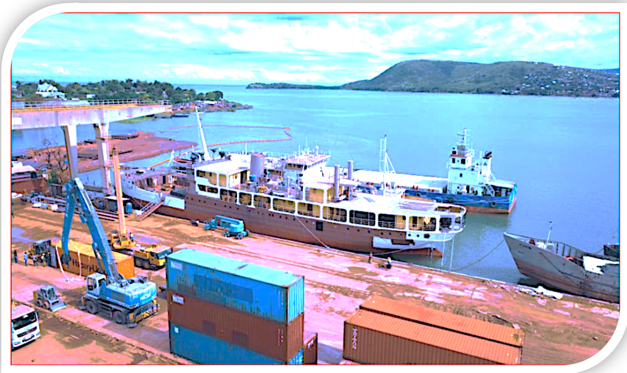
Meli ya MV. Liemba iliyopo katika Ziwa Tanganyika ikiendelea na Ukarabati Mkubwa. Meli hiyo ina uwezo wa kubeba abiria 600 na tani 200 za mizigo kwa wakati mmoja.